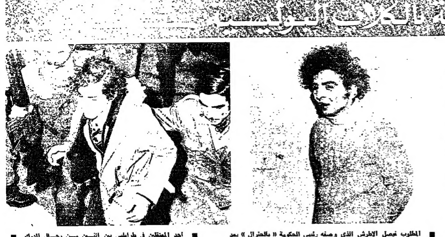
أحد المعتقلين في طرابلس بين اثنين من رجال الدرك ■ اعتقال أميس ■ المطلب فيصل الأطرش الذي وصفه رئيس الحكومة «بالجنرال» بعد

الملك فيصل يزور أسوان بعد دمشق وعمان علمت «الانوار» أن الملك فيصل سيزور أسوان ويجتمع مع الرئيس الورد السادات فيها، وذلك بعد زيارته لدمشق وعمان التي تبدأ يوم الثلاثاء المقبل.